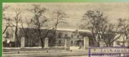
Практична ветеринарна школа при Харківському університеті (Ветеринарний інститут)