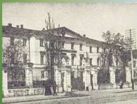
Харківський інститут шляхетних дівчат