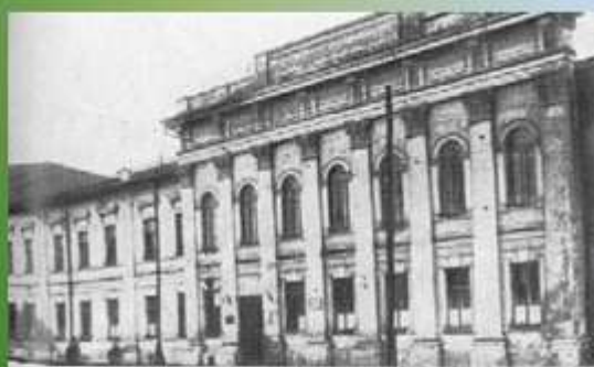
Здание 2-й Харьковской гимназии, где учился И. И. Мечников в 1856—1862 гг.