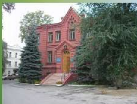
Харківська Єпархіальна школа